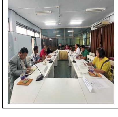
*ภาพถ่ายกิจกรรม